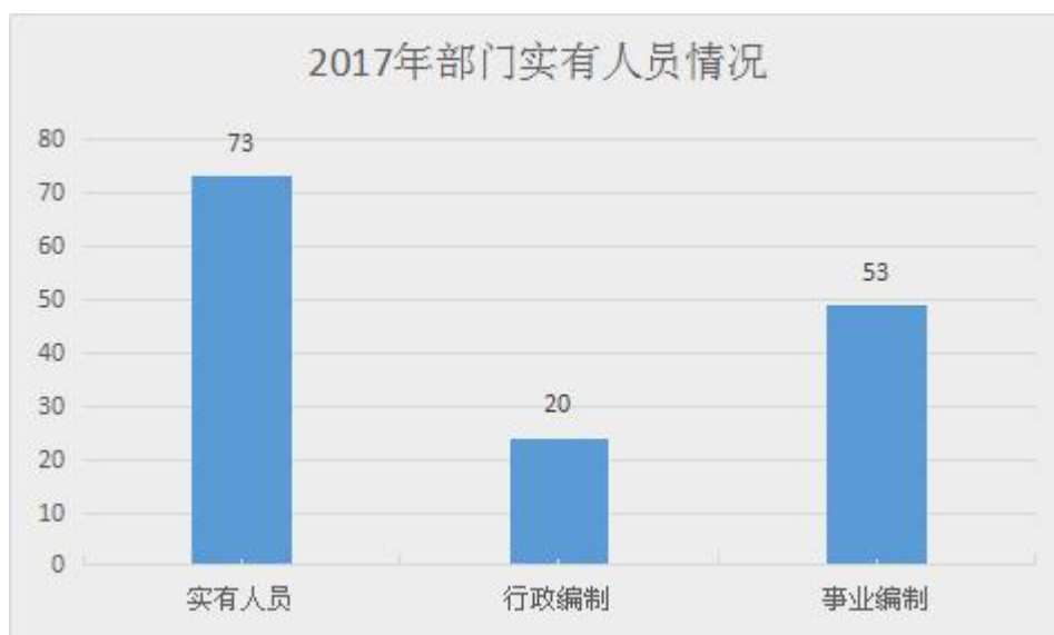
图 2 2017 年部门实有人员情况