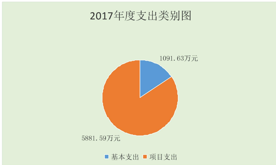
图5 2017年度支出类别图

排、治污降霾网格化建设、铁腕治霾重点减排项目及监测体系建设、在线监测比对实验室建设、山水林田湖生态保护、困难群众冬季取暖补贴、环境监管能力建设、大气污染防治、环境监测中建设及运行等专项业务支出，占总支出的 84.35%。