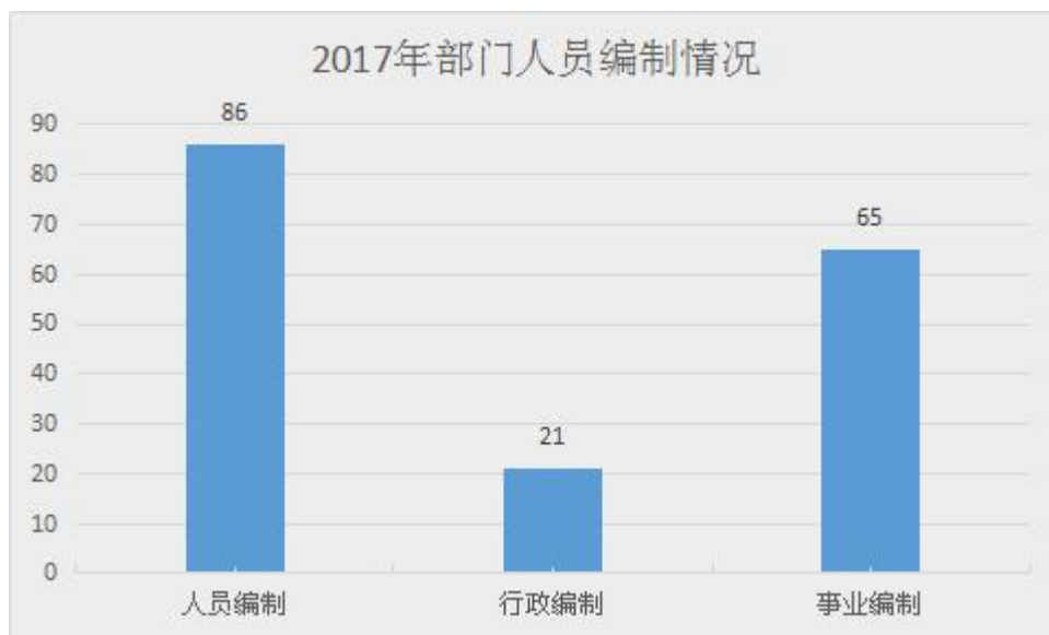
图 1 2017 年部门人员编制情况

截止 2017 年底，本部门人员编制 86 人，其中行政编制 21 人、事业编制 65 人（见图 1）；实有人员 73 人，其中行政 20 人、事业 53 人。单位管理的离退休人员 9 人。